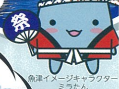
魚津イメージキャラクター ミヲたん