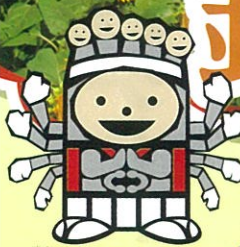
高鍋観光マスコットキャラクター たか鍋大使くん